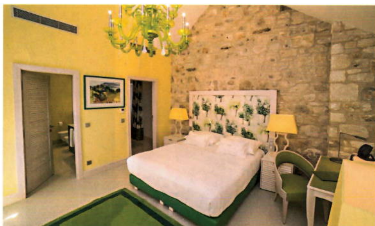
Fotografije: Hotel Lemongarden